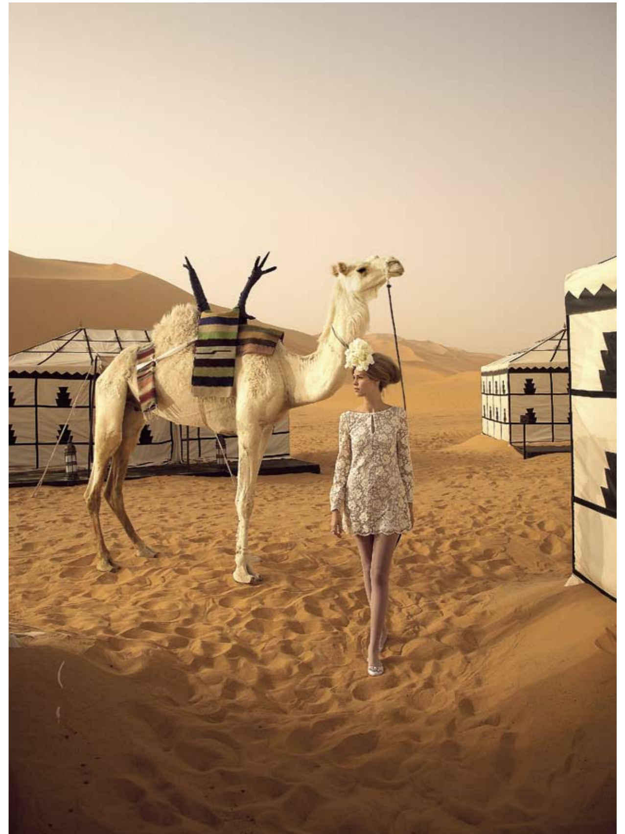
sukienka NATALIA JAROSZEWSKA na zamówienie, pierścionek AGATHA 400 zł, buty RIVER ISLAND 69,90 zł