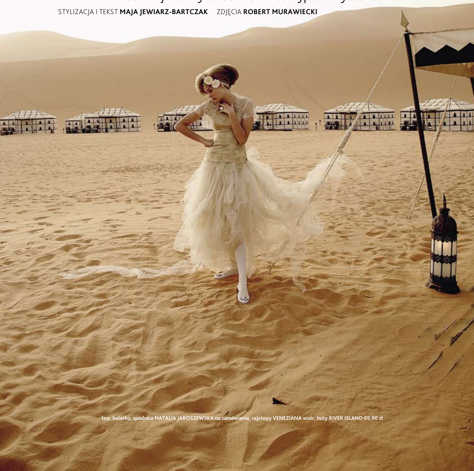
top, bolerko, spódnica NATALIA JAROSZEWSKA na zamówienie, rajstopy VENEZIANA wzór, buty RIVER ISLAND 69,90 zł

STYLIZACJA I TEKST MAJA JEWIARZ-BARTCZAK ZDJĘCIA ROBERT MURAWIECKI